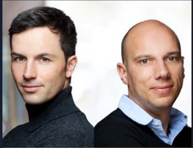
Friedrich & Weik